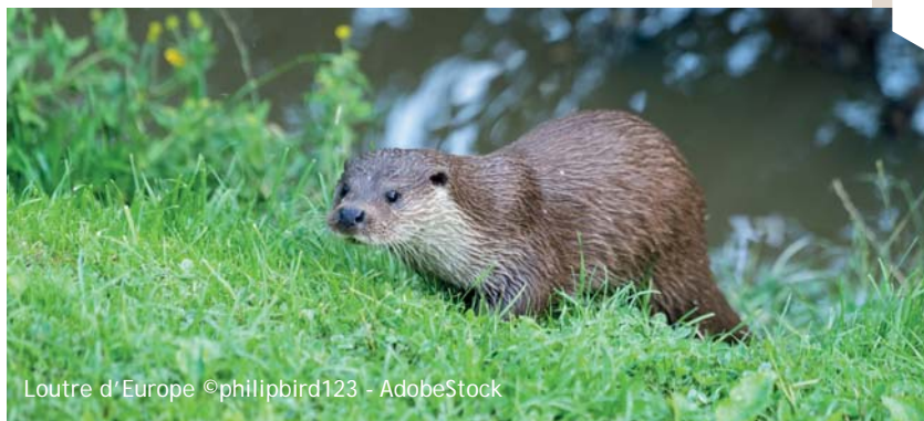
Loutre d'Europe

Natura 2000 est un outil de connaissance des habitats et des espèces animales et végétales, une valorisation des savoir-faire agricoles adaptés, pour une gestion territoriale s'inscrivant dans le développement durable.