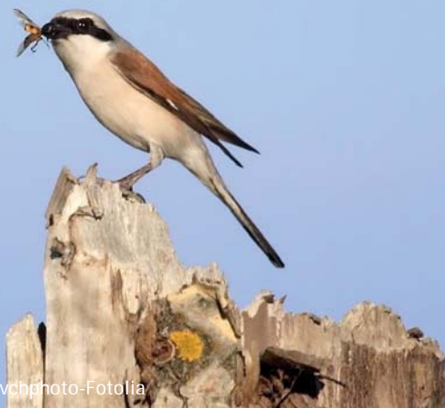
Pie-grièche écorcheur

Oiseau migrateur, il n'est présent dans notre région qu'entre mai et septembre pour la reproduction, avant de repartir vers le Sud de l'Afrique. Très territorial, il fréquente une zone de 100 m autour de son nid caché dans un arbuste épineux. Ouvrez l'œil à la belle saison dans les marais doux de La Tremblade, d'Arvert et de Saint-Augustin ; et guettez le haut des arbustes et les clôtures sur lesquels il aime se percher à l'affût des insectes.