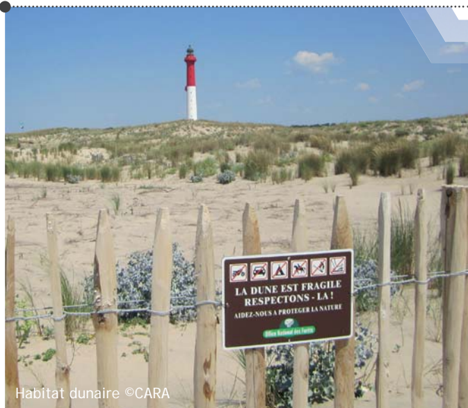
Habitat dunaire