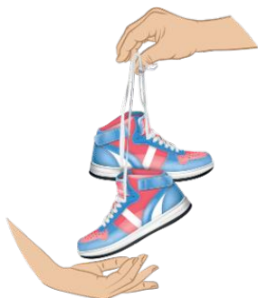
Chaussures attachées par paire