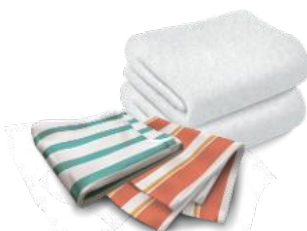
Linge de maison