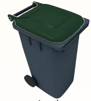
ou point de collecte adapté

Retrouvez toutes les règles de tri de votre commune