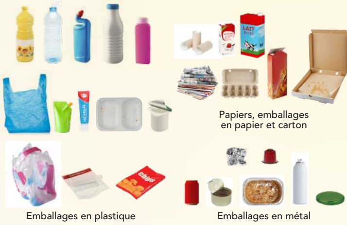
Papiers, emballages en papier et carton

POUR UN TRI EFFICACE ✓ VIDÉS même sales ✓ BIEN SÉPARÉS ✓ EN VRAC pas dans un sac