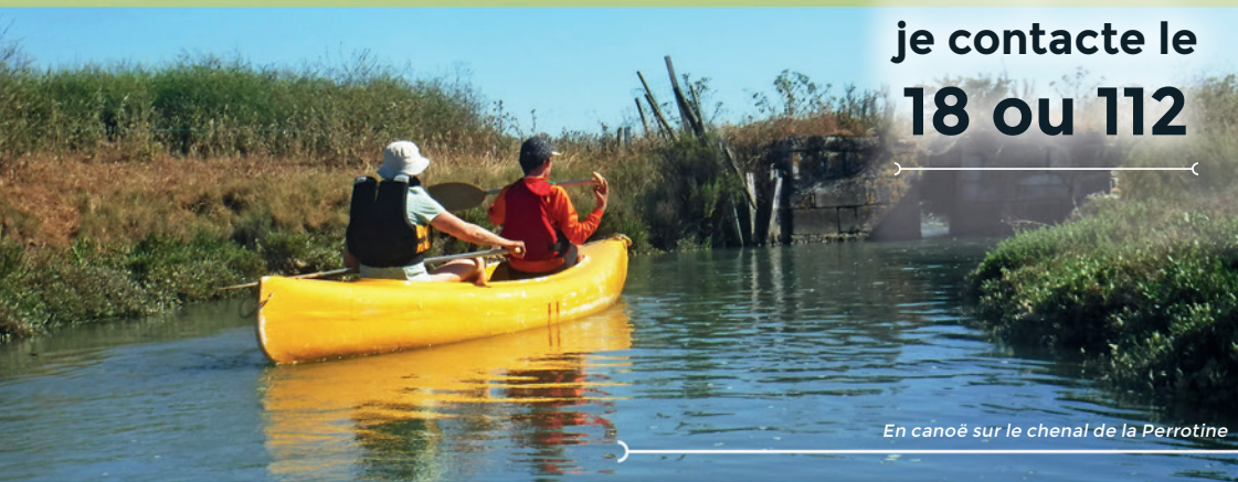
En canoë sur le chenal de la Perrotine

Réalisation REDEMARAIS - PETR du Pays Marennes Oléron. Conception graphique et impression : Atlantique Offset. Publication : Juin 2020.