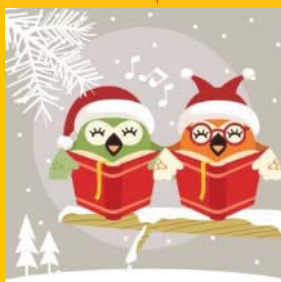
GOUTER DE NOEL

Cette année, le goûter de Noël aura lieu :