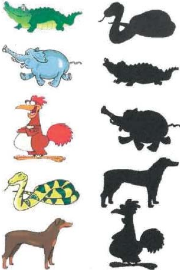
L'ombre des animaux rigolos

Entraînez-vous à imiter la démarche balourde de l'ours, la démarche de la poule, le cri du chat, le long cou de la girafe qui tente d'attraper les feuilles en hauteur.