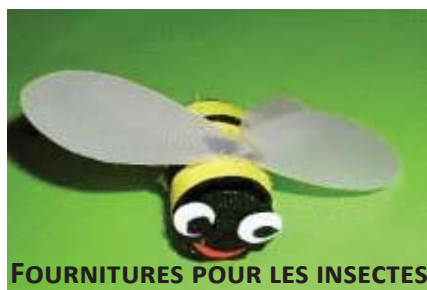
FOURNITURES POUR LES INSECTES

Feuilles de papier couleur Peinture, pinceau, colle en gel Baguette de bois pour brochettes, ciseaux