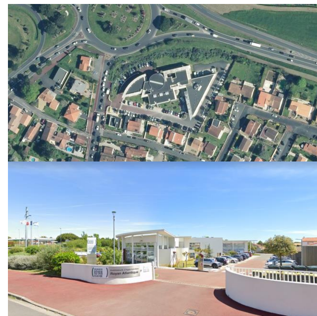
Communauté d'Agglomération Royan Atlantique (CARA)