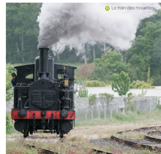
17 Le train des mouettes