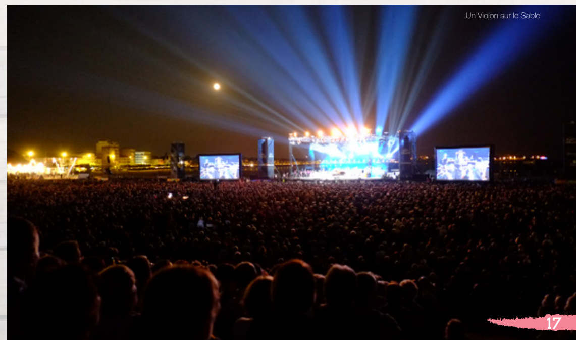
Un Violon sur le Sable