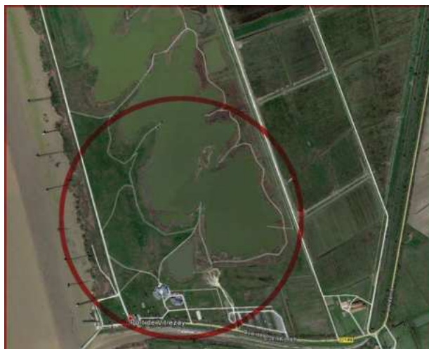
Quelques images du site Echappée nature de Port Maubert