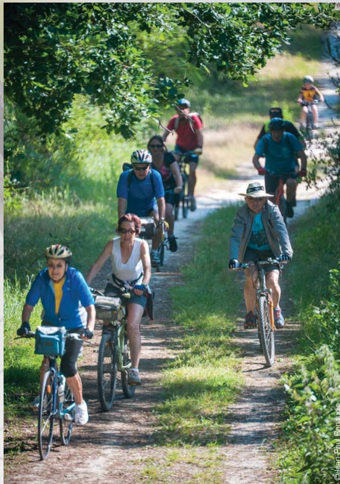
Création : Laurent Pinaud. CARA 2017.

(à partir de 12 € le vélo selon le modèle)