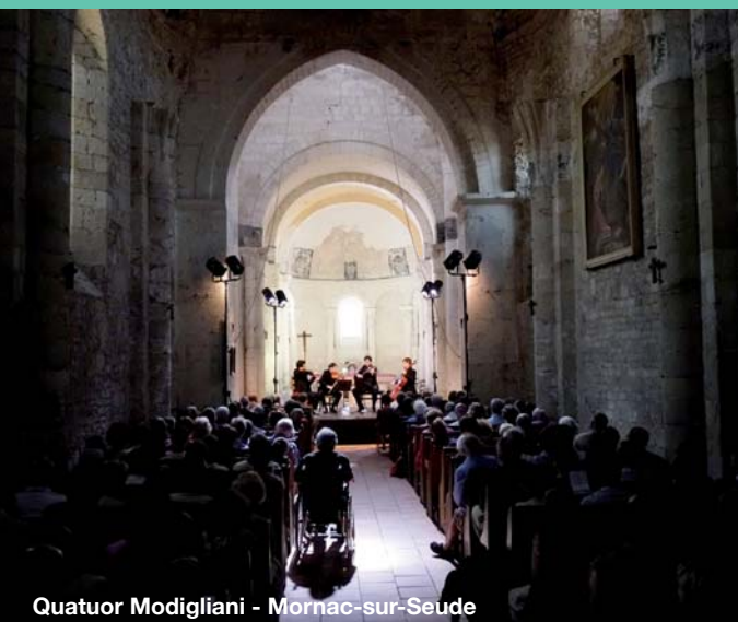
Quatuor Modigliani - Mornac-sur-Seude