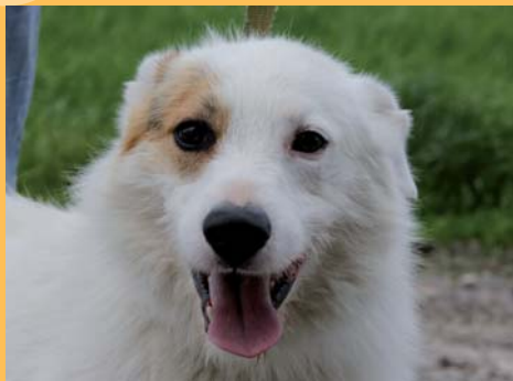
Fly, né en 2002