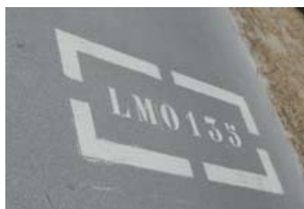
Jalonnement piste cyclable