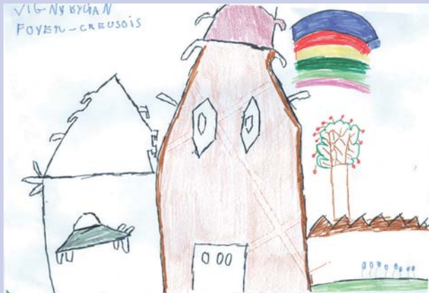
Kylian Vigny (Foyer Creusois)

Tous les enfants qui ont participé aux journées portes ouvertes organisées à la CARA ont été invités à dessiner la maison de demain. Voici deux des plus beaux dessins.