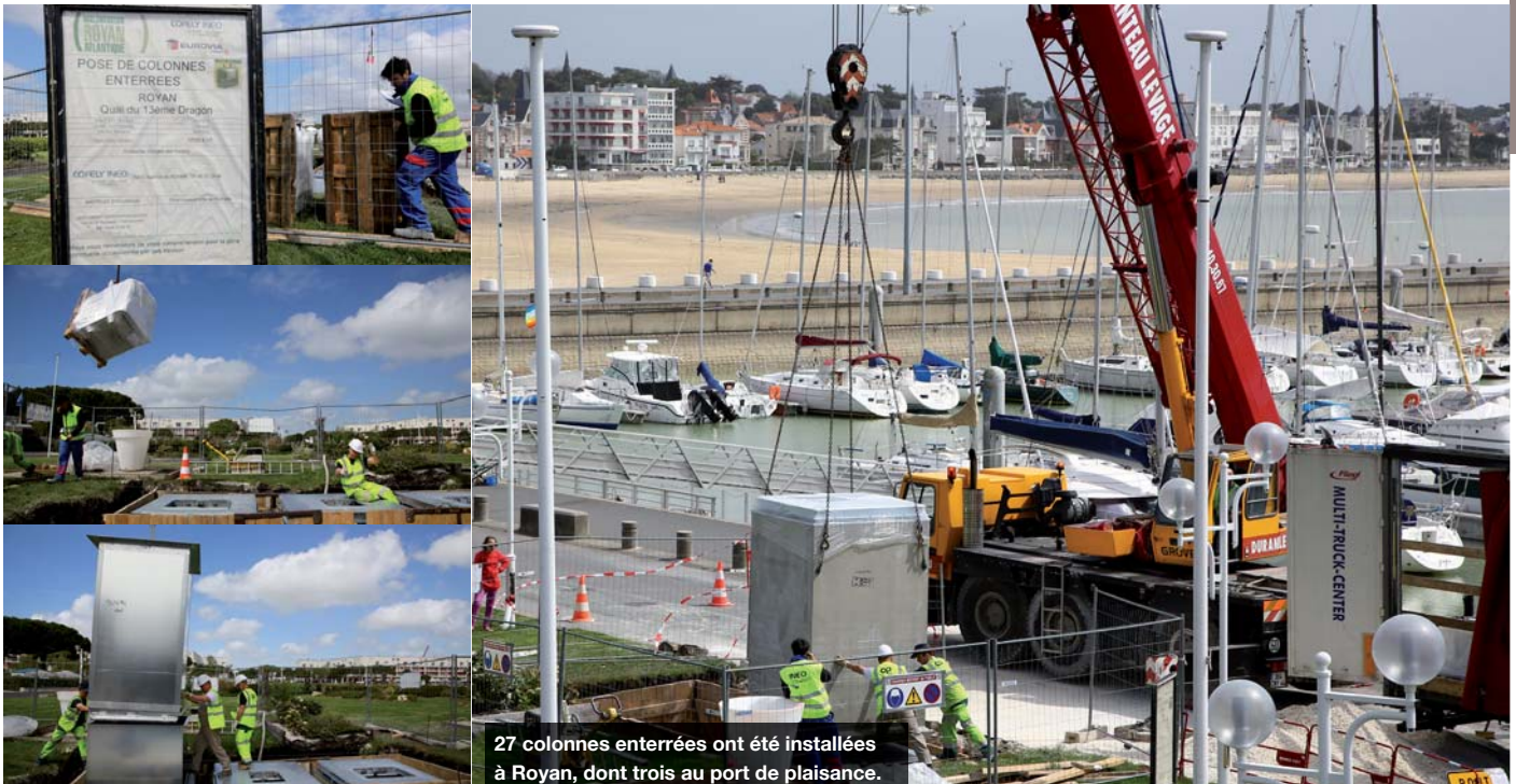
27 colonnes enterrées ont été installées à Royan, dont trois au port de plaisance.

L'Agglomération Royan Atlantique procède depuis le 19 mars à l'implantation de 49 colonnes enterrées pour la collecte des ordures ménagères résiduelles et du verre dans sept communes du territoire :