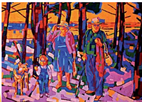
Après-midi au Galon d'Or, huile sur toile 180 cm x 240 cm

Exceptionnellement et uniquement sur rendez-vous au 05 46 36 47 03, il est possible de visiter l'atelier du couple pour découvrir leur univers de création.