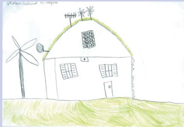
Nolan Guérinet (Saint-Sulpice)