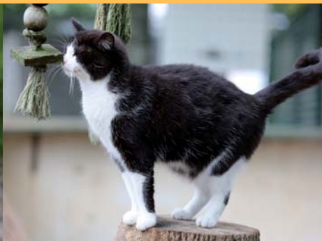
Biscotte, née en 2012

Bien d'autres chats et chiens tatoués et vaccinés vous attendent au refuge. Rendez-leur visite aux horaires d'ouverture au public.