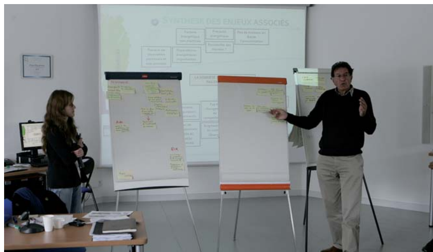
Atelier participatif pour la construction des actions du PCET ayant regroupé élus, techniciens de la CARA et partenaires extérieurs. Au total, près de 100 personnes ont participé à ces différents ateliers climat-énergie.

En France, chaque PCET est soumis à deux objectifs chiffrés majeurs que sont le Paquet Energie-Climat et le Facteur 4. Quelle est leur signification ?