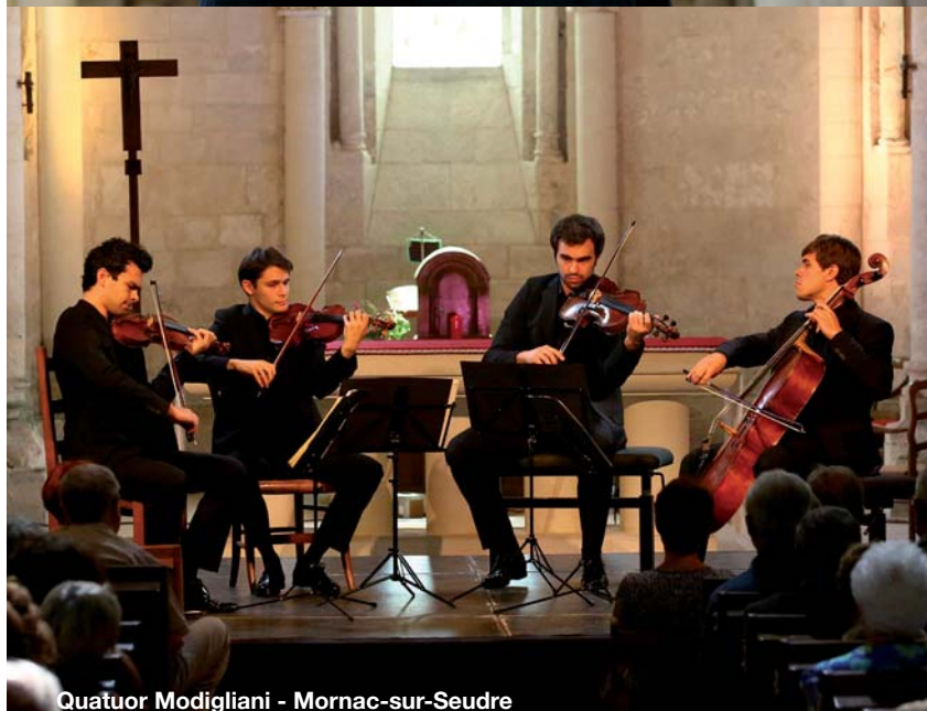
Quatuor Modigliani - Mornac-sur-Seude